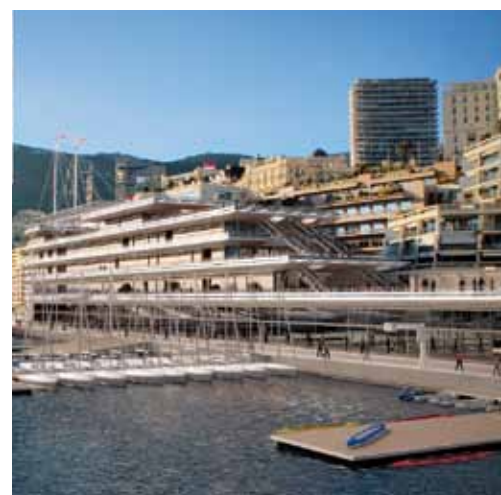
Projet de l'avant-port : image virtuelle du nouveau bâtiment du Yacht Club et les aménagements de la jetée Luciana