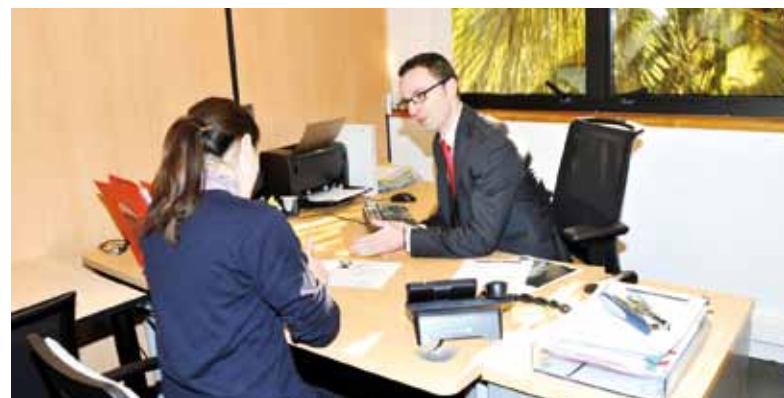
Le Monaco Welcome Board Office, sous la tutelle de la Direction de l'Expansion Économique, accueille les personnes souhaitant ouvrir une activité en Principauté

En matière de création d'entreprises, la Direction de l'Expansion Économique produit très régulièrement des statistiques relatives au nombre de dossiers déposés et de sociétés autorisées par le Gouvernement Princier après passage en Conseil de Gouvernement. Ces données constituent un des indicateurs de l'attractivité de la Principauté pour les créateurs d'entreprises et investisseurs.