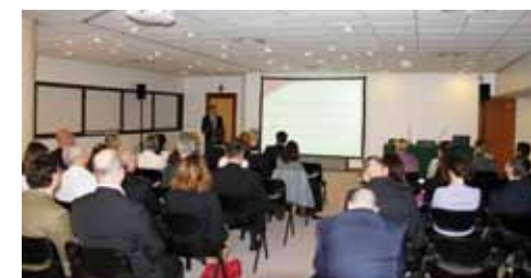
Les éco-référents de l'administration lors d'une réunion organisée par la Direction de l'Environnement

Depuis 2010, le dispositif d'une démarche éco-responsable, à l'initiative de la Direction de l'Environnement, s'est renforcé avec la désignation pour chaque Service de l'Administration d'un référent éco-responsable. Ces derniers sensibilisent les agents et fonctionnaires de l'Etat et jouent un rôle déterminant dans la mise en œuvre d'achats responsables. Grâce aux efforts de chacune et chacun, la consommation d'électricité de l'Administration a notamment diminué de 20% entre 2011 et 2012.