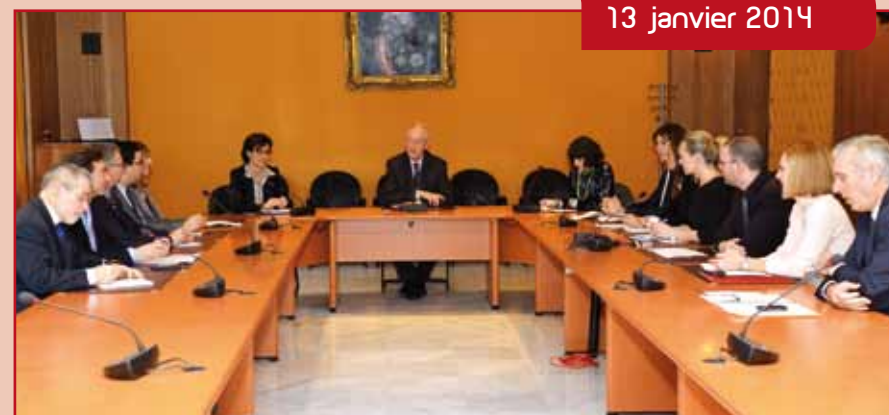
Autour du Ministre d'État, les référents Twitter du Gouvernement Princier