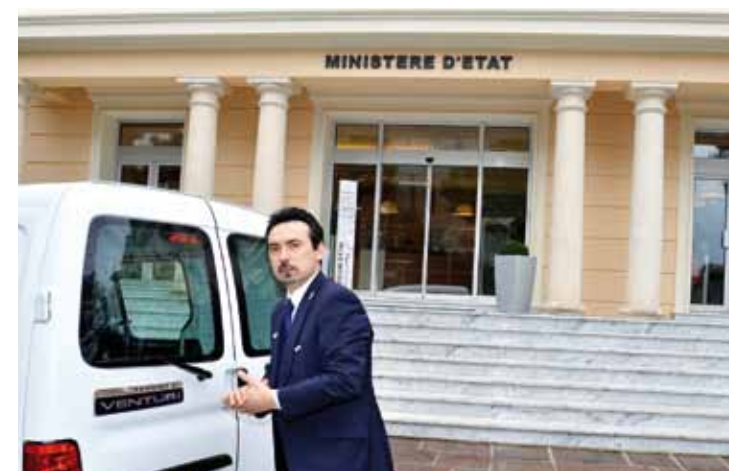
Le véhicule qu'utiliseront désormais les appariteurs du Ministère d'État

sont mis à sa disposition. De plus la Direction Informatique ainsi que la Direction de l'Administration Électronique et de l'Information aux Usagers soutiennent également cette mission en terme de formation et de conseil.